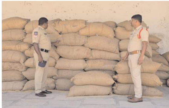
పోలీస్ పెట్రోలింగ్ లో పట్టుబడ్డ వడ్లదొంగలు