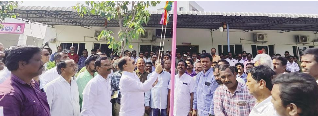
ఆటో కార్మికులతో 30 ఏండ్ల అనుబంధం