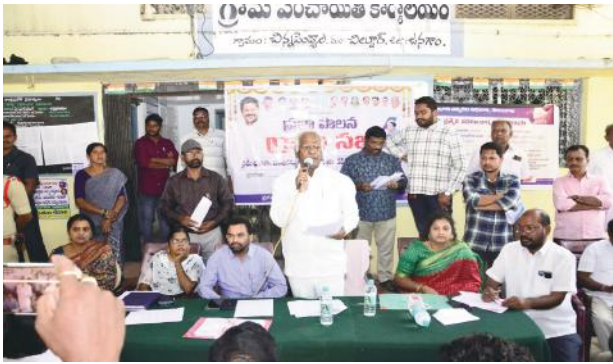
చిన్న పెండ్యాల గ్రామంలో