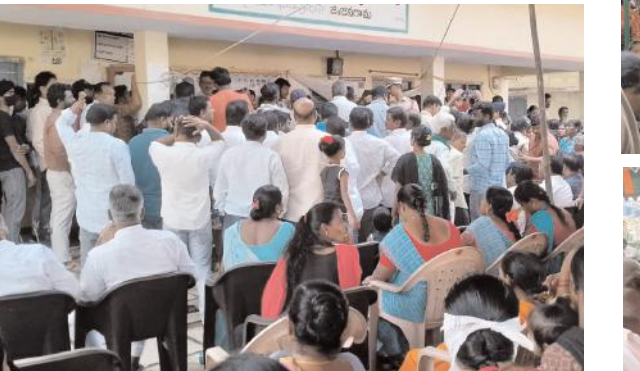
ఉన్నవారిని ఎంపిక చేయడంతో అధికారులపై మండిపడ్డారు. అక్కడే ఉన్నటువంటి సీబి వేణు పోలీసు సిబ్బందితో కలిసి గ్రామస్తులను శాంతింపజేశారు.

స్టేషన్ ఘనపూర్, జనవరి 22, మేజర్ న్యూస్ (సూర్య): జనగామ జిల్లా స్టేషన్ ఘనపూర్ డివిజన్ కేంద్రంతో పాటు మండలంలోని నమిలిగొండ, చాగల్లు గ్రామాలలో బుధవారం నిర్వహించిన గ్రామసభలు రసాభాసగా సాగాయి. ఇందిరమ్మ ఇళ్ల లబ్ధిదారుల అలాగే జాబ్ కార్డు జాబితాలలో అర్హులైన వారి పేర్లు రాకపోవడంతో గ్రామస్తులు అధికారులను నిలదేశారు. డివిజన్ కేంద్రంలో నిర్వహించిన గ్రామసభకు ప్రజలు పెద్ద సంఖ్యలో తరలి రావడంతో ఉద్రిక్త వాతావరణం నెలకొంది. పంచాయతీ కార్యదర్శి లిస్సులో వచ్చిన వారి పేర్లను చదవగా అర్హులైన తమ పేర్లు లిస్సులో రాకపోవడంతో ప్రజలు అధికారులను నిలదేశారు. అధికారులు పొంతన లేని సమాధానం చెప్పడంతో స్టేషన్ ఘనపూర్ కు చెందిన ఓ వ్యక్తి తన వెంట తెచ్చుకున్న దరఖాస్తు పాఠాల కవరును అధికారులపైకి విసిరివేయడం జరిగింది. ఇంట్లో