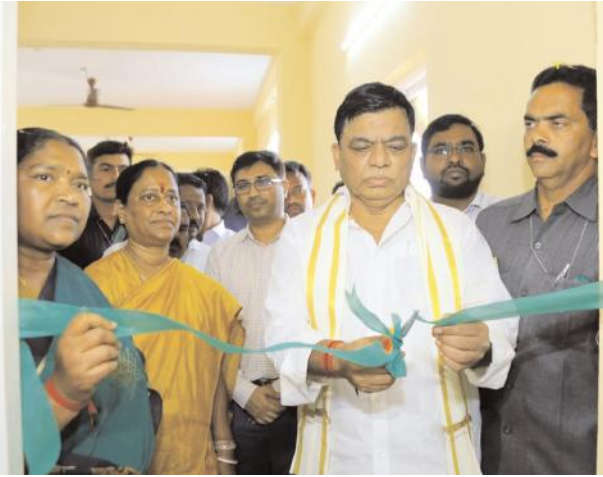
నామకరణం చేస్తామని ప్రకటించారు.

సమ్మక్క సారక్క లాగా పనిచేస్తూ జిల్లాను అభివృద్ధి చేస్తాం : మంత్రి కొండ సురేఖ