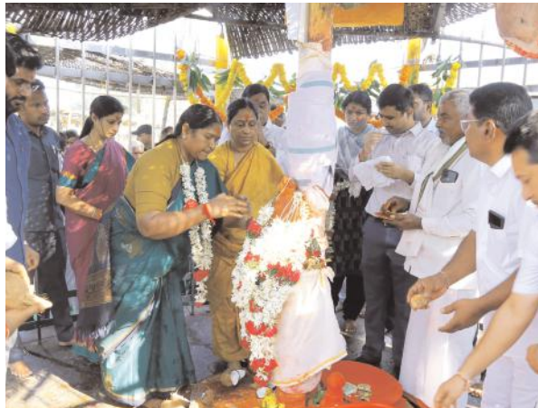
దేవదాయశాఖ అధికారులు, పూజారులు తదితరులు పాల్గొన్నారు.