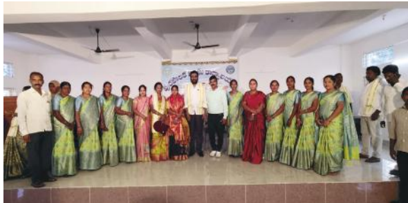
వర్ధన్నపేట, జనవరి 24 (మేజర్ న్యూస్ సూర్య) వర్ధన్నపేట పురపాలక సంఘ