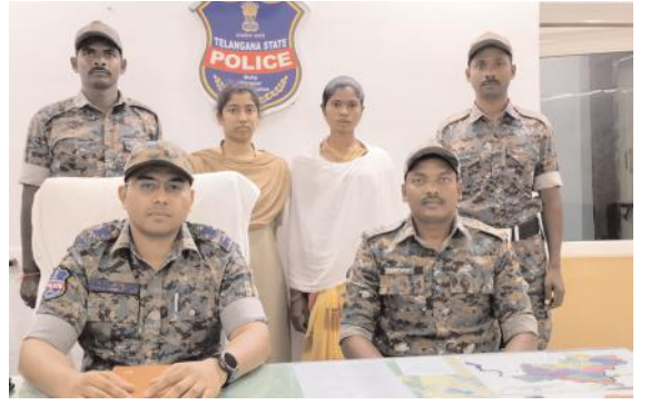
ములుగు ఓఎస్డి ముందు మావోయిస్టు