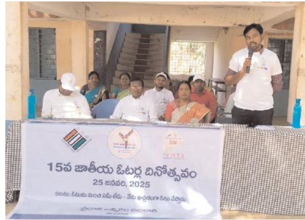
విద్యార్థులు, గ్రామ ప్రజలు తదితరులు పాల్గొన్నారు.