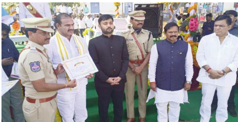
- పురస్కారం అందుకున్న