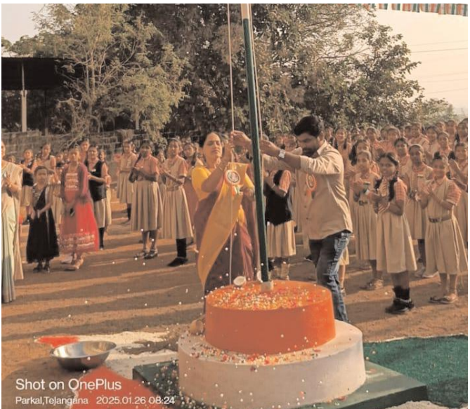
Shot on OnePlus Parkal, Telangana 2025.01.26 08:24