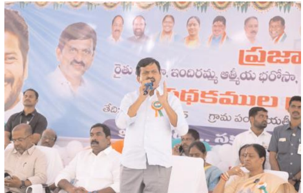
ఇవ్వకూడదని, అర్జులైన ప్రతి ఒక్కరికీ ప్రభుత్వ పథకాలు అందించాలని ముఖ్యమంత్రి రేవంత్ రెడ్డి నాలుగు పథకాలను అమలు చేస్తున్నారని పేర్కొన్నారు. రాజ్యాంగం అమలులోకి వచ్చిన గణతంత్ర దినోత్సవం సందర్భంగా నాలుగు పథకాలను అమలు చేయడం సంతోషకరంగా ఉందన్నారు. రాష్ట్ర ప్రభుత్వం అమలు చేస్తున్న సంక్షేమ పథకాల పట్ల ప్రతిపక్షాలు చేస్తున్న దుష్ప్రచారం ప్రజలు నమ్మవద్దన్నారు.

వరంగల్ ఎంపీ డాక్టర్ కడియం కావ్య, వర్తన్లుపేట ఎమ్మెల్యే కేఆర్ నాగరాజు మాట్లాడుతూ ఇచ్చిన ప్రతి హామీని ప్రభుత్వం నెరవేర్చుతుందన్నారు. వర్తన్లుపేట నియోజకవర్గం దళిత నియోజకవర్గమని పేర్కొన్నారు. దళితులు ఎక్కువగా ఉన్న నియోజకవర్గ వర్గం కాబట్టి రాష్ట్ర ప్రభుత్వం ఇస్తున్న 9500 కాకుండా మరో 1500 ఇందిరమ్మ ఇండ్లను కేటాయించాలని రాష్ట్ర రెవెన్యూ శాఖ మంత్రి పొంగులేటి శ్రీనివాస్ రెడ్డిని కోరారు. అర్జులకు తప్పనిసరిగా ప్రభుత్వ పథకాలను అందిస్తామన్నారు.