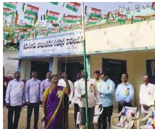
ప్రభుత్వ కార్యాలయాల్లో 76వ గణతంత్ర దినోత్సవ