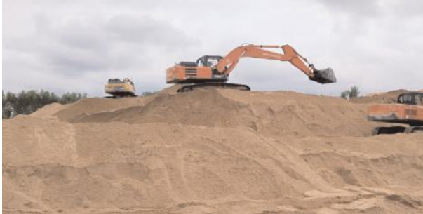
వినిపిస్తున్నాయి.యంత్రాలను వినియోగిస్తూ ఇసుక తవ్వకాలు జరపడం వల్ల నదీ పరివాహక ప్రాంతంలో వ్యవసాయం దెబ్బతినడంతో పాటు, పర్యావరణ సమతుల్యానికి విఘాతం కలుగుతోందని ఆరోపణలు వెల్లువెత్తుతున్నాయి.

ఈ ఇసుక ర్యాంప్లో కూలీల సహాయంతో ట్రాక్టర్లలో ఇసుక నింపాలనేది ప్రభుత్వ నిబంధన. ఇక్కడ మచ్చుకైనా కానరావడం లేదు. గుత్తేదారులు రాత్రిపూట యంత్రాల సాయంతో ఇసుకను తోడేసి టిప్పర్లలో తరలిస్తున్నారు. ఇలా ఇసుక తోడటంతో గోదావరి పరివాహక ప్రాంతంలో అనేక చోట్ల సొరంగాలను తలపించేలా పరిస్థితి తయారైంది. గుత్తేదారులు ముందుచూపుతో వేలాది టన్నుల ఇసుకను ఒడ్డుకు చేర్చి ఆన్లైన్లో పెట్టారు. టిప్పర్లు, యంత్రాలు యధేచ్ఛగా గోదావరి నదిలో తిరగడానికి అక్రమంగా ఓ రోడ్డునే నిర్మించారు. ఇసుక డంపింగ్ రాత్రి సమయంలో యంత్రాలతో చేపడుతున్న అధికారులు అడ్డుకున్న దాఖలాలు కనిపించడం లేదు స్థానిక ప్రజాప్రతినిధుల అధికారులు అండదండలతో ఇసుక అక్రమార్కులు చెలరేగిపోతున్నారు అనే ఆరోపణలు ఉన్నాయి. చొక్కాల ఇసుక రీవ్ అక్రమాల వెనుక అధికార పార్టీకి చెందిన ఓ కీలక నేత ప్రమేయం ఉందన్న ఆరోపణలు బలంగా