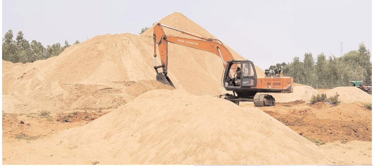
మొదటి పేజీ తరువాయి..

ర్యాంపు నుంచి రెండు లక్షల 50 వేల క్యూబిక్ మీటర్ల ఇసుకను కూలీల సహాయంతో తీసుకెళ్లడానికి గిరిజన మహిళా సొసైటీకి అనుమతులు మంజూరు చేశారు. ఇంతవరకు బాగానే ఉన్నా.. అసలు కథ కొద్దిరోజుల నుంచి ప్రారంభమైంది. ప్రస్తుతం నిబంధనలను తుంగలో తొక్కుతూ ఇసుక ర్యాంపు నిర్వహణ సాగుతోంది. గోదావరి నది ఒడ్డున ఉన్న ఈ ఇసుక ర్యాంపు కొందరు గుత్తేదారుల చేతుల్లోకి వెళ్లింది. ఇక్కడ వారు ఆడిందే ఆట, పాడిందే పాటగా తయారైంది.