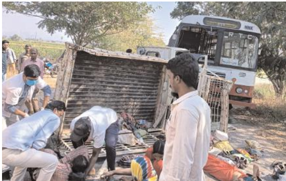
కమలాపూర్ లో ఘోర రోడ్డు ప్రమాదం