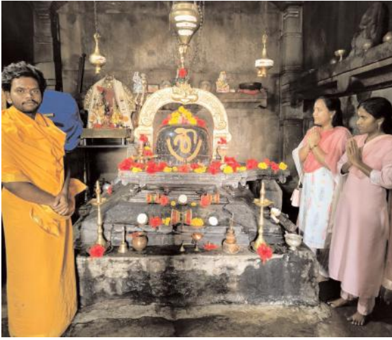
కోట గుళ్ళు లో గణపురం, రేగొండ మెడికల్ ఆఫీసర్ల పూజలు