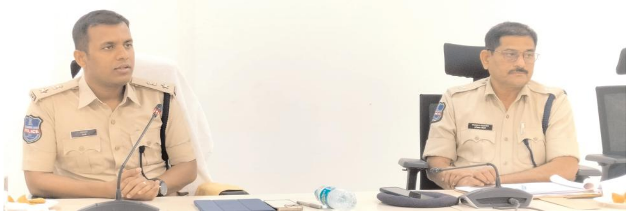
ఆఫ్ ఇన్వెస్టిగేషన్ ద్వారా నేరస్తులకు శిక్షపడే విధంగా చేసి బాధితులకు