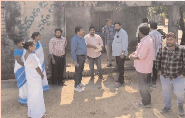
కంటైనర్ ఆరోగ్య ఉపకేంద్రం స్థల పరిశీలన