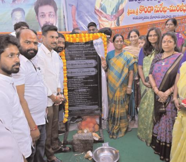
కార్యక్రమాలను అందిస్తామని ఈ సందర్భంగా మంత్రి తెలిపారు. అనంతరం శాఖ రాశి కుంట నుండి కీర్తి బార్ వరకు గల నాలను పరిశీలించి నాల కు ఆనుకొని ఉన్న స్థలం ఆక్రమణకు గురికాకుండా ఇరిగేషన్, రెవెన్యూ అధికారులు వెంటనే సర్వే నిర్వహించాలని, బల్లియా అధికారులను నాలను శుభ్రం చేయాలని మంత్రి ఆదేశించారు.