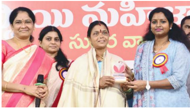
సుస్థిర వ్యాపార మహిళా వికాసం నినాదంతో మార్కెటింగ్ సొసైటీ బాలవికాస రాష్ట్రస్థాయి మహిళా మహాసభ