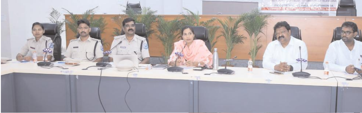
మితిమీరిన వేగంతో వాహనాలు నడపరాదు

18 సంవత్సరాల నిండిన ప్రతి ఒక్కరు డ్రైవింగ్ లైసెన్స్ తీసుకోవాలి