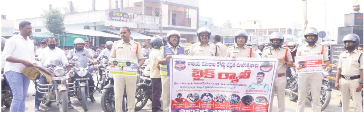
రోడ్డు భద్రత మహోత్సవాలు