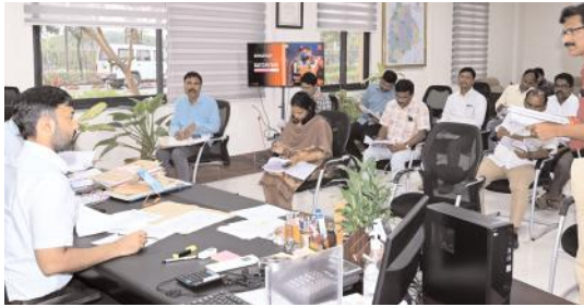
ఇంటర్మీడియట్ పరీక్షల నిర్వహణకు