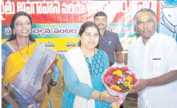
వచ్చే విధంగా మెలుకులు నేర్పించాలని మామిడి మార్కెటింగ్ సంబంధించినటువంటి అంశాలను పరిశీలించి తగు చర్యలు తీసుకుంటానని రైతులకు జిల్లా కలెక్టర్ తెలిపారు. జిల్లా కలెక్టర్ ఆదేశానుసారం రాయపర్తి పర్యవేదిక వర్ధన్నపేట మండలాల్లో గల మామిడి సాగు చేసే సుమారు రెండు