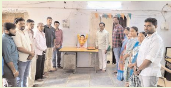
చదువుల తల్లి సావిత్రిబాయి పూలే జయంతి వేడుకలు