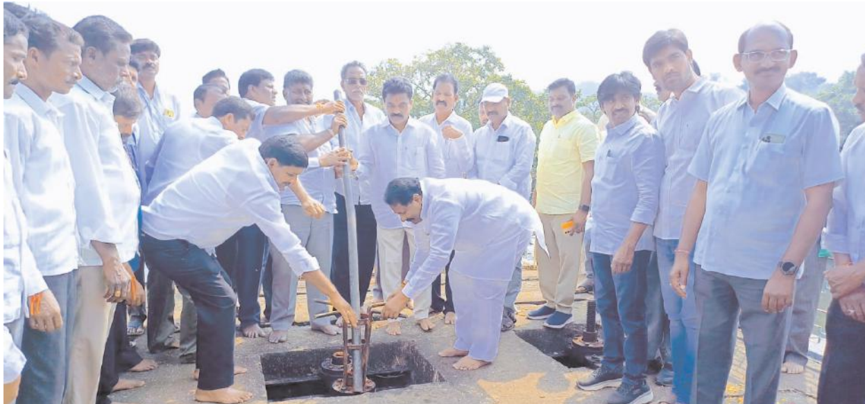
పాఖాల చెరువు రబీ ఆయకట్టుకు సాగు నీరును విడుదల పాఖాల ఆయకట్టు రైతులకు రబీ సాగుకు పూర్తి ఆయకట్టు వరకు నీరు అందిస్తాం