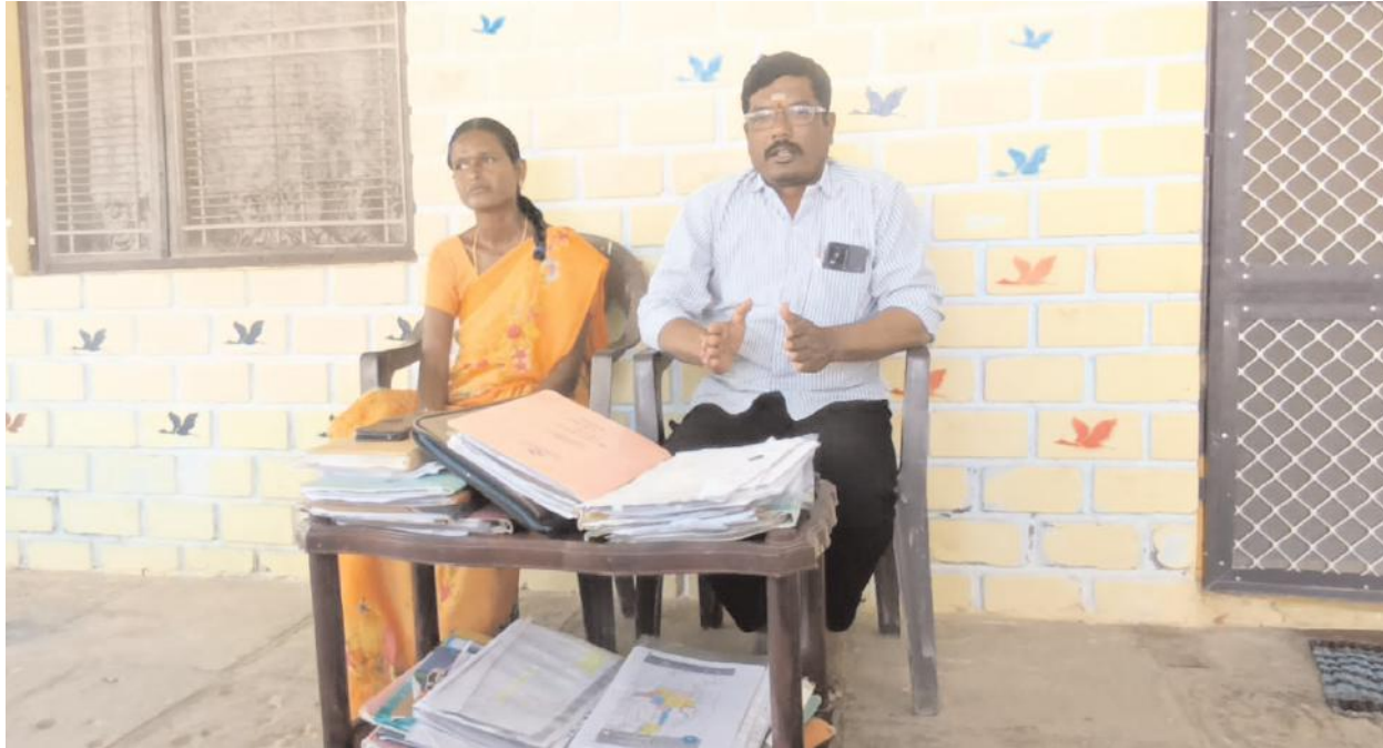
మాజీ రెవెన్యూ సిబ్బంది, అతని ముఠా దళంతో ప్రాణహాని