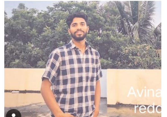
విద్యుత్ షాక్ తో కాలేజీ విద్యార్థి మృతి