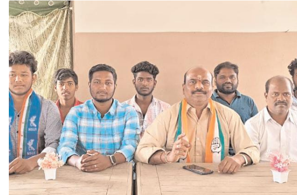
సామ్మూ దోచుకోవడానికి కేటీఆర్ ప్రయత్నం చేశాడని దాన్ని అడ్డుకున్నందుకు