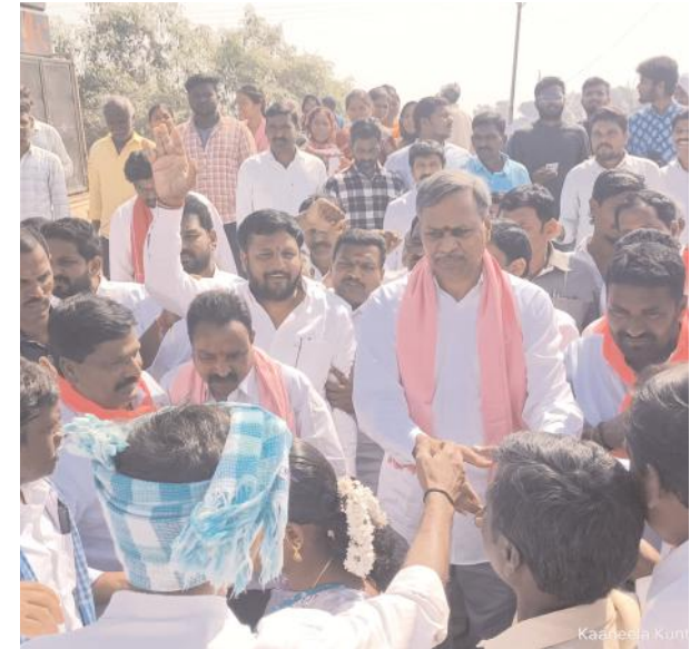
మహిళలు పెద్ద ఎత్తున పాల్గొన్నారు