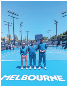
- తరువాయి 2లో..