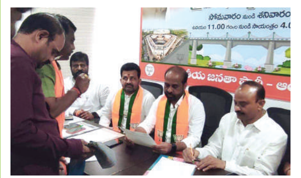
- తరువాయి 2లో..

నరసాపురం ప్రభుత్వ ఆసుపత్రిలో మౌలిక సదుపాయాలు