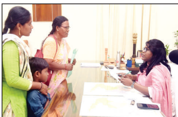
దరఖాస్తును పరిశీలించి చర్యలు తీసుకోవాలని జంగారెడ్డిగూడెం ఆర్డీఓని కలెక్టర్ వెట్రిసెల్వీ ఆదేశించారు. వీరితోపాటు పలువురు ప్రజలు తమ సమస్యలపై కలెక్టర్ వెట్రిసెల్వీ కి వినతి పత్రాలు సమర్పించారు.