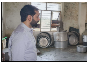
ఉపయోగించాలని, పరికరాల వినియోగంలో భద్రత