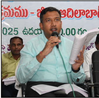
కార్యక్రమాన్ని నిర్వహించడం జరిగింది.

- జిల్లా పాలనాధికారి రాజర్షి షా అదిలాబాద్, సూర్య మేజర్ న్యూస్ : గ్రామ పంచాయతీ, ఎంపిటిసీ జడ్చీటిసీ ఎన్నికల -2025 నిర్వహణకు సన్నద్ధం కావాలని జిల్లా పాలనాధికారి రాజర్షి షా అన్నారు. గ్రామ పంచాయతీ, ఎంపిటిసీ, జడ్చీటిసీ ఎన్నికలు, 2025- రిటర్నింగ్, అనిస్టేంట్ రిటర్నింగ్ అధికారులకు శుక్రవారం జిల్లా ప్రజా పరిషత్ సమావేశ మందిరంలో ఏర్పాటుచేసిన శిక్షణ (మిశా 2 లో)