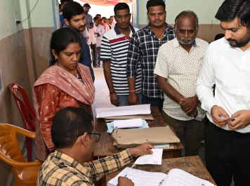
ఓటు హక్కును వినియోగించుకుంటున్న ఆసిఫాబాద్ ఎన్నికల అధికారి, జిల్లా కలెక్టర్ వెంకటేష్ దోశ్

నియోజకవర్గాల ఉపాధ్యాయ, పట్టభద్రుల ఎన్నికల పోలింగ్ ప్రక్రియ సజావుగా నిర్వహించాలని ఆసిఫాబాద్ జిల్లా ఎన్నికల అధికారి, కలెక్టర్