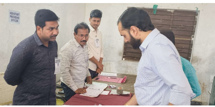
అసంతరం జిల్లా కలెక్టర్ తన గ్రామ్యుల్ ఓటు హక్కును వినియోగించుకున్నారు. ఈ కార్యక్రమంలో పోలింగ్ సిబ్బంది తదితరులు పాల్గొన్నారు.

కొనసాగుతుందని తెలిపారు. పోలింగ్ కేంద్రంలో ఓటర్లకు ఎలాంటి ఇబ్బందులు తలెత్తకుండా త్రాగునీరు, విద్యుత్, వెలుతురు ఇతర మౌలిక సదుపాయాలు కల్పించడం జరిగిందని, నాయంత్రం 4 గంటలకు పోలింగ్ ముగిసే సమయానికి వరసలో నిలబడి ఉన్న వారికి చిట్టీలు అందించి వారందరూ ఓటు హక్కు వినియోగించుకునేలా చర్యలు తీసుకోవడం జరిగిందని తెలిపారు.