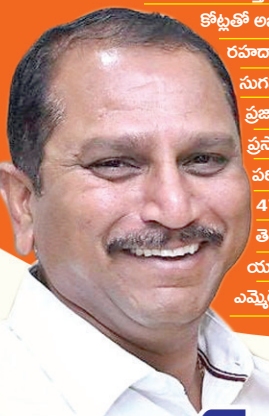
అనంతపురం బ్యూరో, మేజర్ స్వాస్