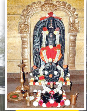
దక్షిణాభిముఖముగా వెలసిన ఆదిత్యుని మూలవిరాట్