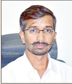
అందజేయాలని సూచించారు. ఈ అవకాశాన్ని జిల్లా ప్రజలు సద్వినియోగం చేసుకోవాలని కోరారు.

ఈనెల 24వ తేదీన సోమవారం అనంతపురం కలెక్టరేట్ లో ప్రజా సమస్యల పరిష్కార వేదిక (పబ్లిక్ గ్రివెన్స్ రీడ్రెస్ ల్ సిస్టం, విజిఆర్ఎస్) కార్యక్రమం నిర్వహించడం జరుగుతుందని జిల్లా కలెక్టర్ డాక్టర్ వినోద్ కుమార్.వి, ఐ.ఏ.ఎస్ ఒక ప్రకటనలో తెలిపారు. ప్రజా సమస్యల పరిష్కార వేదిక కార్యక్రమాన్ని కలెక్టరేట్లోని రెవెన్యూ భవనంలో ఉదయం 9 గంటల నుంచి మధ్యాహ్నం 1 గంటల