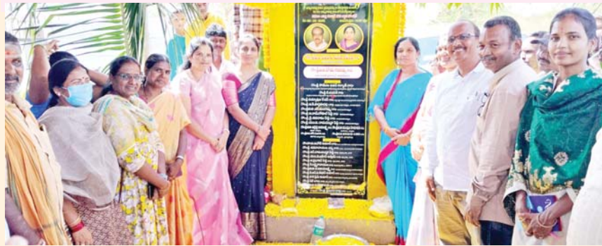
ఇచ్చిందన్నారు. అందుకే రాష్ట్రాడు నియోజకవర్గంలో చాలా గ్రామాలకు రోడ్లు వచ్చాయిన్నారు. సీసీ రోడ్లు, బీటీ రోడ్లు పెద్ద ఎత్తున వేస్తున్నట్లు చెప్పారు. ఇదంతా ముఖ్యమంత్రి చంద్రబాబు వలనే సాధ్యమవుతోందన్నారు. రానున్న రోజుల్లో రోడ్ల సమస్యలు లేకుండా చేస్తామని ఎమ్మెల్యే సునీత స్పష్టం చేశారు.