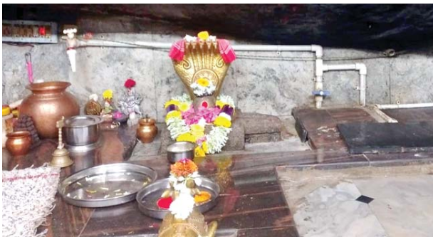
గవి మఠంలో వెలిసిన గవి సిద్ధేశ్వర స్వామి