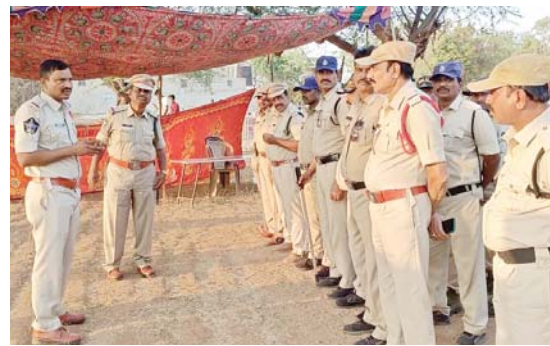
నారాయణ స్వామి పరమ ప్రశాంతంగా జరిగేలా విధులు నిర్వహించాలని సిబ్బందికి తెలిపారు.