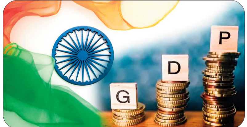
ఉంది: indiabudget.gov.in/economicsurvey/index.php ఈ లింక్లో మీరు మునుపటి సంవత్సరాల ఆర్థిక సర్వే నివేదికలను చూడవచ్చు. డౌన్లోడ్ చేసుకోవచ్చు.

ఆర్థిక సర్వే నివేదికను డౌన్లోడ్ చేయడం ఎలా? : ఈరోజు పార్లమెంట్లో ఆర్థిక సర్వే నివేదికను నిర్మల సీతారామన్ సమర్పించడం పూర్తయిన వెంటనే, అది ఆన్లైన్లో అప్లోడ్ చేస్తారు. ఇది ప్రభుత్వానికి చెందిన ఇండియా బడ్జెట్ వెబ్సైట్ నుండి డౌన్లోడ్ చేసుకోవచ్చు. దాని లింక్ ఇక్కడ