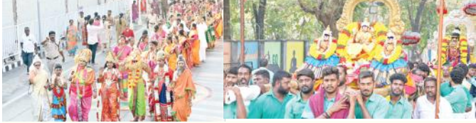
కల్పవృక్ష వాహనంపై ధనలక్ష్మి అలంకారంలో

పెట్టుకోవాలన్నారు. జిల్లా నందు పరీక్షలు నిర్వహించే 13 పరీక్షా కేంద్రాల్లో సిసిటివి కెమెరాల ఏర్పాటు చేయాలన్నారు. జేసీ అన్ని పరీక్షా కేంద్రాలను తనిఖీ చేయాలని, పరీక్షలు సజావుగా నిర్వహించేందుకు అన్ని ఏర్పాట్లు చేపట్టాలని ఆదేశించారు. గ్రూప్ -2 పరీక్షలు పేపర్ -1 ఉ. 10:00 గంటల నుంచి మ. 12:30 గంటల వరకు, పేపర్ -2 మ. 3.00 గం.ల నుండి సాయంత్రం 05.30 గం.ల వరకు పరీక్షలు జరుగుతాయన్నారు. పేపర్ -1 పరీక్షకు హాజరయ్యే అభ్యర్థులు ఉదయం 08:30 గంటల నుంచి 9.30 గంటల లోపు చేరుకోవలసి ఉంటుందని. పేపర్ -2 పరీక్షకు హాజరయ్యే అభ్యర్థులు మధ్యాహ్నం 01.30 నుండి 2.30 వరకు మాత్రమే అభ్యర్థులను పరీక్షా కేంద్రంలోనికి అనుమతి ఉంటుందని, అదనంగా గ్రేస్ పీరియడ్ ఉదయం మధ్యాహ్నం 15 నిమిషాలు వరకు మాత్రమే అనుమతి ఉంటుందని, కావున అభ్యర్థులు పరీక్ష కేంద్రానికి సకాలంలో చేరుకోవాలని అన్నారు. పబ్లిక్ సర్వీస్ కమిషన్ ఆదేశాల మేరకు సీసీ కెమెరాల పర్యవేక్షణలో ఈ పరీక్షలు నిర్వహిస్తారన్నారు. పరీక్షా కేంద్రాల్లోకి మొబైల్ ఫోన్, ఎలక్ట్రానిక్ పరికరాలు, ఎలక్ట్రానిక్ వాచ్, వైరెస్ హెడ్ సెట్స్, తదితర ఎలక్ట్రానిక్ వస్తువులు అనుమతి ఉండదని, పరీక్షా కేంద్రాల వద్ద పోలీస్ బందోబస్తు ఏర్పాటు, ఆర్డీసీ బస్సు సౌకర్యం, విద్యుత్ అంతరాయం లేకుండా సంబంధిత శాఖల అధికారులు చూడాలని, తాగునీరు, టూలెట్స్ సక్రమంగా ఉండాలని, అభ్యర్థుల సౌకర్యార్థం సకాలంలో పరీక్షా కేంద్రాలకు చేరుకునే విధంగా ఆర్డీసీ వారు ప్రత్యేక చర్యలు తీసుకోవాలన్నారు. కార్యక్రమంలో డిఆర్ఓ నరసింహులు, ఏపీఎస్సీ అధికారులు, ముఖ్య అధికారులు, ఇన్స్పెక్టర్లు పాల్గొన్నారు.