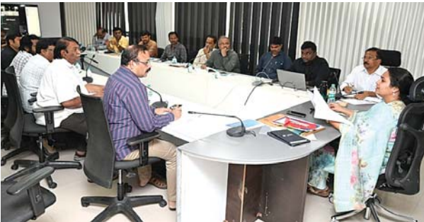
తిరుపతి బ్యూరో, మేజర్ న్యూస్: