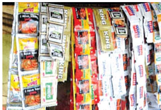
యువతకు గుర్తుండేలా పలు చర్యలు తీసుకోవాలని ప్రజల అభిప్రాయపడుతున్నారు.

యువతలో అవగాహన మార్పు రావాలంటే... పోలీసు శాఖ వారు తగునైన హెచ్చరికలు జారీ చేస్తూ దీనిపై ప్రత్యేక చర్యలు తీసుకుంటామని, ఇంటర్మీడియట్ స్థాయి నుంచి ప్రతి కళాశాల, విశ్వవిద్యాలయాల్లో, హాస్టల్లో అవగాహన సదస్సులు ఏర్పాటు చేస్తూ ఈ మారకద్రవ్యాల వల్ల మీజీవితాలు నాశనం అవుతాయని తెలియపరస్తూ వల్ల నుంచి పట్టణ ప్రాంతాల్లో నివసించే ప్రజలకు కనపడేలాగా వాల్ పోస్టర్లు వేయించి పెద్ద ఎత్తున పదే పదే