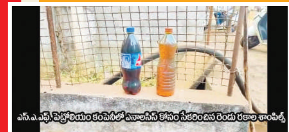
ఎస్.ఎ.ఎఫ్ పెట్రోలియం కంపెనీలో పోలీస్ కింగ్ సెక్యూరిటీ సెలక్షన్ కాలిబ్రే