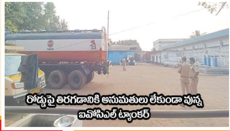
రోడ్డుపై తిరగడానికి అనుమతులు లేకుండా వున్న ఐవోసిఎల్ ట్యాంకర్

వాయువులు తీవ్రంగా వున్నట్లున్నారు. ఇంధ్రపాలెం రోడ్డు నుంచి సామర్లకోట వెళ్ళే దారిలో రోడ్డుపైకి, ఆటోనగర్ పరిసర ప్రాంతాల్లో ఈ పెట్రోలియం కంపెనీ నుంచి వచ్చే వాయువుల వల్ల ప్రజలు తీవ్ర ఇబ్బందులు నిత్యం పడుతూనే ఉన్నారు. అక్కడి ప్రజలకు కళ్ళు మసకబారడం, ఊపిరితిత్తుల్లో మంట, దగ్గు, వికారం, వాంతులు అవుతుండడం