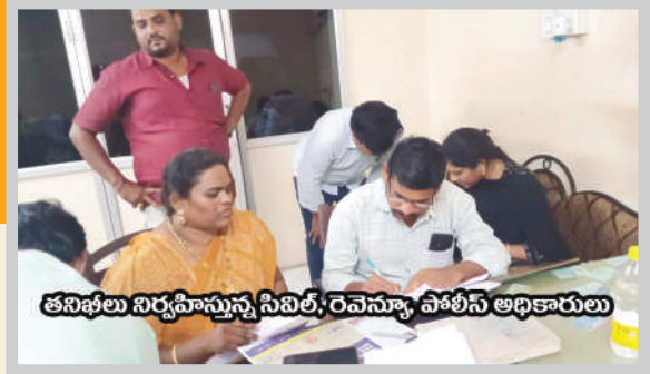
తనిఖ్యలు నిర్వహిస్తున్న సివిల్, రెవెన్యూ, పోలీస్ అధికారులు