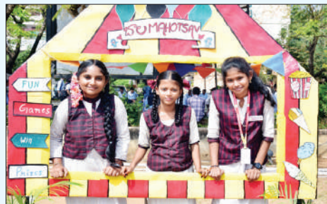
50కు పైగా ఈవెంట్ల నిర్వహణ విజ్ఞాన్ యూనివర్సిటీ ప్రతిష్టాత్మకంగా తొలిసారిగా నిర్వహిస్తున్న బాల మహోత్సవంలో జూనియర్స్ ( 5

జీవితంలో స్థిరపడుతారని పేర్కొన్నారు. కృషి చేసిన వారే ఉన్నత స్థానాలకు : పర్వతీ వైస్ చాన్సలర్ కల్వల్, ప్రొఫెసర్ పి.నాగభూషణ్ జీవితంలో కష్టపడి పనిచేయడంతో పాటు బాగా కృషి చేసిన వారే ఉన్నత స్థానాలను అధిరోహిస్తారని పర్వతీ వైస్ చాన్సలర్ కల్వల్, ప్రొఫెసర్ పి.నాగభూషణ్ అన్నారు. మీ కలల సాకారానికి అంకితభావంతో కృషి చేస్తే ఉన్నతంగా ఎదిగే శక్తి సామర్థ్యాలు మీలో ఉన్నాయని అన్నారు. క్రీడలు శారీరక ఉల్లాసానికి కాకుండా మానసిక ఉల్లాసానికి కూడా దోహదపడుతాయని అన్నారు. శారీరక, మానసిక ధృఢత్వంతో పాటు స్నేహ సంబంధాలు మెరుగుకు క్రీడలు దోహదం చేస్తాయన్నారు. చదువుతో పాటు క్రీడలు, సృజనాత్మకత అంశాలపై ప్రావీణ్యం సాధించినప్పుడే సంపూర్ణ విద్యార్థులు అవుతారని పేర్కొన్నారు.