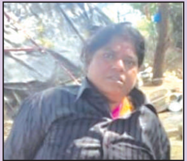
మా గుడిసెల దగ్గరికి మాయ మాటలు చెప్పి ఓట్లు వేయమని చెప్పి, ఓట్లు వేయించుకొని గెలిచిన తర్వాత మా గుడిసెలు వైపు కన్నెత్తినా చూడడం లేదని ఆవేదన వ్యక్తం చేశారు.

ప్రవేశపెట్టిన గృహ నిర్మాణ పథకం కాలనీ వాసులకు వర్తించకపోవడంతో వూరి గుడిసెల్లో నివసిస్తున్నారు. రోడ్డు, డ్రైనేజీలు లేక రోడ్లపై మురుగు మీరు చేరి రోగాల బారిన కొడుతున్నారు. ఆరోగ్య సిబ్బంది ఈ కాలనీలో సందర్శించిన దాఖలాలు లేవు. ప్రతిరోజూ చిత్తు కాలుతాలు, ఎలుకలను పట్టి వారి పిల్లలను పోషించుకుంటూ దుర్భర జీవనాన్ని అనుభవిస్తున్న ప్రభుత్వ అధికారులకు పట్టకపోవడం శోచనీయం. త్రాగునీరు అందుబాటులో లేకపోవడం వలన ఇతర ప్రదేశాల నుండి మీరు తెచ్చుకొని వరిస్తే. ఇలాంటి కాలనీలో చదువు లేక బాల కార్మికులుగా మిగిలిన బాలలు కళ్ళకు కట్టినట్టుగా కనిపిస్తున్న అధికారులు గుర్తించలేకపోవడం విచారకం. ఇప్పటికైనా సంబంధిత అధికారులు స్పందించి అభివృద్ధికి నోచుకోని యానాది కాలనీని గుర్తించి సదుపాయాలు సమకూర్చవలసిన అవసరం ఎంతైనా ఉంది.