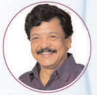
Shri Kandula Lakshmi Durgesh Prasad Garu Minister for Tourism and Culture Government of Andhra Pradesh