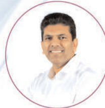
Shri Pemmasani Chandrasekhar Garu Hon'ble Minister of State for Communications of India & Guntur M.P