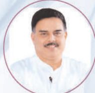
Shri Nadendla Manohar Garu Hon'ble Minister of Civil Supplies, Food & Consumer Affairs