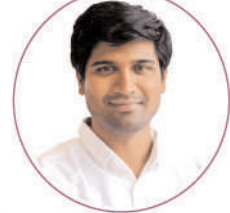
Shri Lavu Sri Krishna Devarayalu Garu Hon'ble Member of the Lok Sabha, Narasaraopet M.P