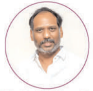
Sri Gottipati Ravi Kumar Garu Hon'ble Minister of Energy of Andhra Pradesh