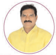
Sri Nimmala Rama Naidu Garu Minister of Water Resources of Andhra Pradesh