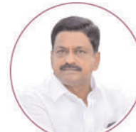
Shri Payyavula Keshav Garu Hon'ble Minister of Finance