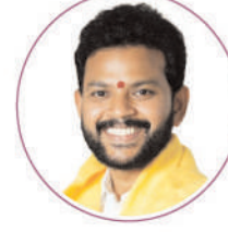
Shri Kinjarapu Ram Mohan Naidu Garu Minister of Civil Aviation of India