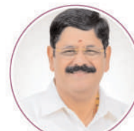
Shri Anam Ramanarayana Reddy Garu Hon'ble Minister of Endowments