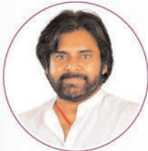
Shri Konidela Pawan Kalyan Garu Hon'ble Deputy Chief Minister, Panchayati Raj, Rural Development & Rural Water Supply Environment, Forest, Science & Technology

Shri Nara Chandrababu Naidu Garu Hon'ble Chief Minister of Andhra Pradesh