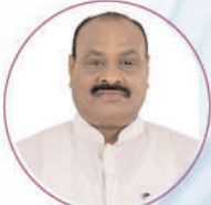
Shri Kinjarapu Atchannaidu Garu Minister of Agriculture of Andhra Pradesh