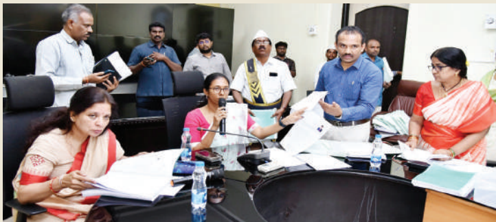
గుంటూరు జిల్లా నేటి దినపత్రిక సూర్య బ్యూరో

30 ఎమ్మెల్సీ నామినేషన్లు సక్రమమే - 10 నామినేషన్లు తిరస్కారం