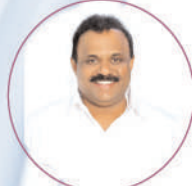
Shri Anagani Satya Prasad Garu Hon'ble Minister for Revenue, Registration and Stamps