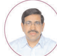
Dr Ponguru Narayana Garu Hon'ble Minister of Municipal Administration & Urban Development