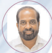
Shri Satya Kumar Yadav Garu Hon'ble Minister of Health, Family Welfare and Medical Education of Andhra Pradesh