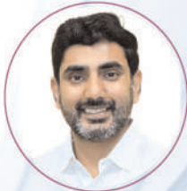
Shri Nara Lokesh Garu Hon'ble Human Resources Development, IT Electronics & Communication, RTG, Minister