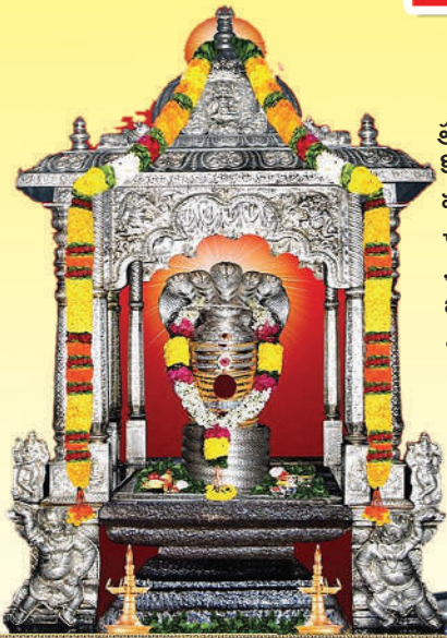
శ్రీ త్రికోటేశ్వరస్వామి వారు - కోటప్పకొండ