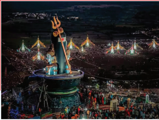
పల్నాడు జిల్లా నేటి దినపత్రిక సూర్య జ్యూరీ

పరమేశ్వరుడు జ్ఞానోపదేశం ఇచ్చిన పవిత్ర పుణ్యక్షేత్రమే కోటప్పకొండ. సృష్టికర్త బ్రహ్మదేవునికే జ్ఞానోపదేశం ఇచ్చిన ప్రదేశంగా యుగయుగాల నుంచి ఖ్యాతిచెందింది. 'చేదుకో కోటయ్య.. మమ్మాదుకోవయ్యా...' అంటూ యల్లమంద కోటయ్యగా ప్రజల పూజలందుకొనే త్రికోటేశ్వరస్వామి వారి దేవాలయం గుంటూరు జిల్లా నరసరావు పేట సమీపంలోని కోటప్పకొండ గ్రామంలో ఉంది. మహాశివరాత్రి పర్వదినాల్లో అత్యంత రద్దీగా భక్తజనంతో నిండిపోతుంది.