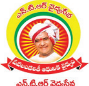
ఎన్.టి.ఆర్ వైద్యసేవ ఎన్.టి.ఆర్ వైద్యసేవ మందుల ఎంపికైన హెల్త్ సీక్రెట్ (EHS) పర్యవేక్షణ ద్వారా అన్ని రకాల ఆపరేషన్లు ఇదిగోరా చేయబడును.