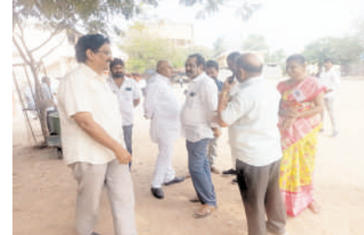
సీనియర్ నాయకులు ఎర్రబాతుల శివ, అమరనాథ్, కార్యకర్తలు డివిజన్ నాయకులు నగర నాయకులు పాల్గొన్నారు.