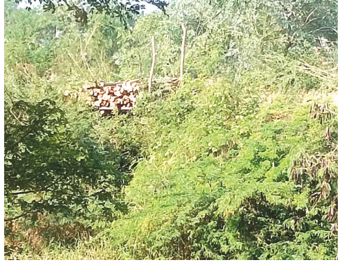
కోడెల లాంటి నాయకుడు కావాలి

పెదసందిపాడు బ్రాంచ్ కాలపై ఉన్న చెట్లను నరికి నాలుగైదు ట్రాక్టర్ల మొద్దులను నరసరావుపేట అడితీతి అమ్ముతుంటే ఎన్ఎస్ఐ అధికారులకు తెలియకుండా జరిగిందంటే నమ్మకశ్యం కాదు. కచ్చితంగా ఆ శాఖ అధికారుల హస్తం ఉండే ఉంటుంది. స్థానికుల, మీడియా కంట పడనంత కాలం కుమ్మక్కై సొమ్ము చేసుకున్నారు. పత్రికల్లో కథనాలు రావడంతో.. ఆ శాఖ అధికారులు మా హస్తము లేదన్నట్లుగా ఓ ఫిర్యాదును పోలీస్ స్టేషన్లో పడవేశారు. ఫిర్యాదు ఇచ్చినా పోలీస్ స్టేషన్ లో కేసు నమోదు కాలేదు. ఈ విధంగా హారిత హంతకులకు ఈ రెండు శాఖలు భరోసా కలిపిస్తూ బంపర్ ఆఫర్ ఇస్తున్నారు.