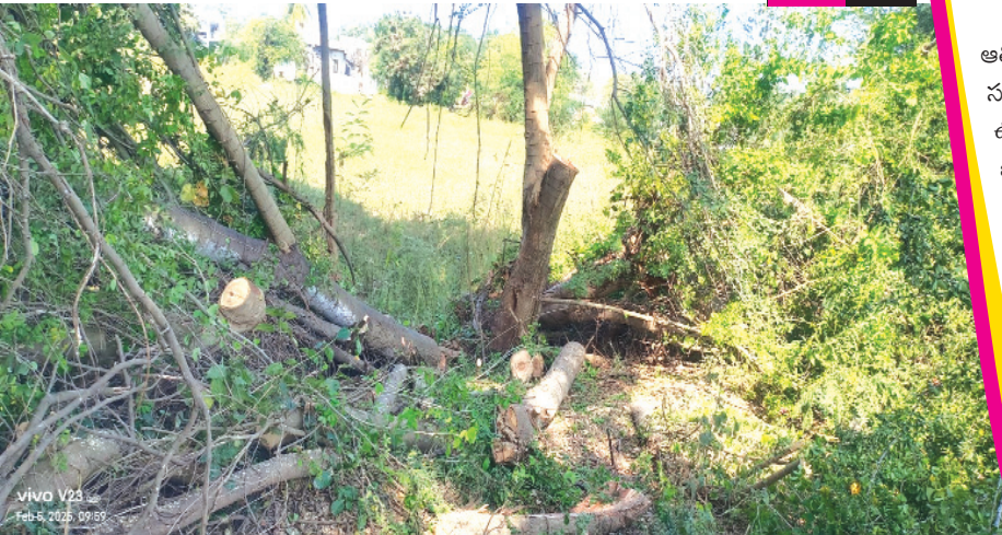
vivo V24 Feb 5, 2025, 09:53