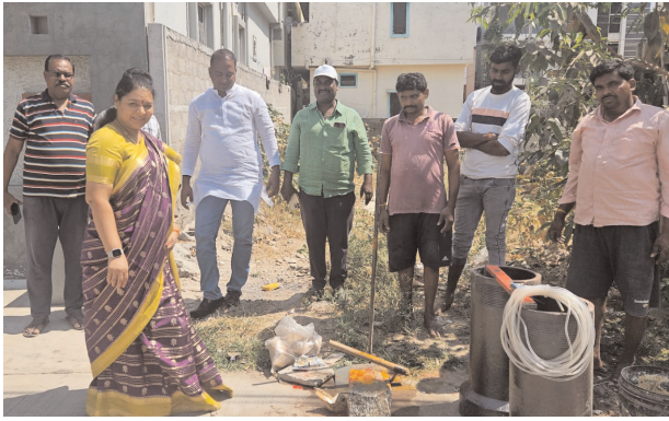
కర్నూల్ ఘాట్, మేజర్ న్యూస్ :హస్తినాపురం డివిజన్ పరిధిలోని ప్రతి కాలనీ లో అభివృద్ధి పనులకు నిధులు మంజూరు చేయించి చూలిక సదుపాయాల