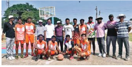
తెలిపారు. ఈ పోటీలలో శుక్రవారం కబడ్డీ, బ్యాడ్మింటన్, క్రో బాల్, వాలీబాల్, టేబుల్ టెన్నిస్, పరుగు, హై జంప్ పోటీలు నిర్వహించినట్లు వారు

రైల్వే కోడూరు (రూరల్) మేజర్స్ క్యాంప్ : రైల్వే కోడూరు మండలంలోని అనంతరాజుపేట ఉద్యాన కళాశాలలో గత రెండు రోజులగా జరిగిన క్రీడలునేటితోముగుస్తున్నట్లు కళాశాల యాజమాన్యం తెలిపింది. ముఖ్యంగా కళాశాలలో నిర్వహిస్తున్న 11వ తేదా సాంస్కృతిక సాహిత్య పోటీలలో నేటితో తుది దశకు చేరినట్లు వారు పేర్కొన్నారు. అయితే శుక్రవారం ముగింపు కార్యక్రమంలో గెలుపొందిన క్రీడాకారులకు వి సి డాక్టర్ గోపాల్ అధ్యక్షతన బహుమతులు ప్రశంస పత్రాలు పంపిణీ చేస్తారని