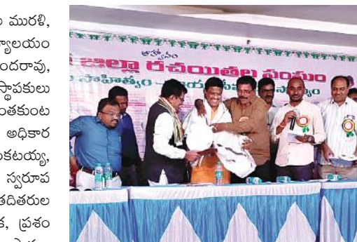
కడపలో సత్కారం అందుకుంటున్న తెలుగు పండితులు, కవి గంగనపల్లి వెంకటరమణ...