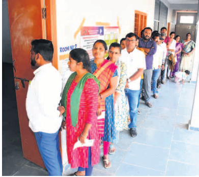
ఎల్లారెడ్డిపేట మండల కేంద్రం జిల్లా పరిషత్ ఉన్నత పాఠశాలలోని 386,387 పట్టణాల్లోని పోలింగ్ కేంద్రాలను, 193 ఉపాధ్యాయ పోలింగ్ కేంద్రం, ముస్తాబాద్ మండల కేంద్రం జిల్లా పరిషత్ ఉన్నత పాఠశాలలోని 381,382 పట్టణాల్లోని పోలింగ్ కేంద్రాలను, 190 ఉపాధ్యాయ పోలింగ్ కేంద్రాలను సందర్శించి, పోలింగ్ సరళిని కలెక్టర్ పరిశీలించారు. మొత్తం మీద ఎమ్మెల్సీ ఎన్నికల పోలింగ్ రాజన్న సిరిసిల్ల జిల్లాలో ఎలాంటి అవాంఛనీయ సంఘటనలు జరగకుండా ప్రశాంత వాతావరణంలో ముగిసింది.

శాతం పోలింగ్ నమోదయింది. సాయంత్రం నాలుగు గంటల తర్వాత కూడా కొన్ని పోలింగ్ కేంద్రాలలో ఓటింగ్ కొనసాగింది. ఎమ్మెల్సీ ఎన్నికల సందర్భంగా జిల్లాలోని ఆయా పోలింగ్ కేంద్రాలను కలెక్టర్ సుధీప్ కుమార్ రూపా గురువారం సందర్శించి ఓటింగ్ సరళిని పరిశీలించారు. ఈ సందర్భంగా సిరిసిల్ల పట్టణం కుసుమ రామయ్య జిల్లా పరిషత్ ఉన్నత పాఠశాలలోని 374,375,376 పట్టణాల్లోని పోలింగ్ కేంద్రాలను, గీతానగర్ జిల్లా పరిషత్ ఉన్నత పాఠశాలలోని 371,372,373 పట్టణాల్లోని పోలింగ్ కేంద్రాలను, 187 ఉపాధ్యాయ పోలింగ్ కేంద్రాన్ని పరిశీలించిన కలెక్టర్ ఎన్నికల అధికారులకు పలు సూచనలు చేశారు. కోనరావుపేట మండల కేంద్రం జిల్లా పరిషత్ ఉన్నత పాఠశాలలోని 363,364 పట్టణాల్లోని పోలింగ్ కేంద్రాన్ని, 183 ఉపాధ్యాయ పోలింగ్ కేంద్రం, వీర్వల్లి మండల కేంద్రం జిల్లా పరిషత్ ఉన్నత పాఠశాలలోని 385 పట్టణాల్లోని పోలింగ్ కేంద్రాన్ని, 192 ఉపాధ్యాయ పోలింగ్ కేంద్రం, గంభీరావుపేట మండల కేంద్రం ప్రభుత్వ జూనియర్ కళాశాలలోని 379,380 పట్టణాల్లోని పోలింగ్ కేంద్రాలను, 189 ఉపాధ్యాయ పోలింగ్ కేంద్రం,