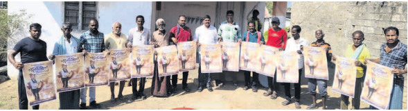
గోడ పత్రికను ఆవిష్కరించిన ఎమ్మార్ఎస్ నాయకులు