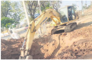
అర్బన్ కాలనీ నుండి పట్టణం వరకు ఉన్న భగీరథ పైపు లైన్ తరచుగా పగిలి నీరు

జగిత్యాల జిల్లా ఇబ్బందిపట్టు మండలం దబ్బా వాటర్ గ్రీడ్ నుంచి మెట్పల్లికి తాగునీటి సరఫరా చేసే మిషన్ భగీరథ పై లైన్ లీకేజీలు ఏర్పడ్డాయి. దీంతో సుమారు 12 వేల ఇండ్లకు నీటి సరఫరా నిలిచిపోయింది. అర్బన్ కాలనీ నుండి పట్టణం వరకు ఉన్న భగీరథ పైపు లైన్ తరచుగా పగిలి నీరు