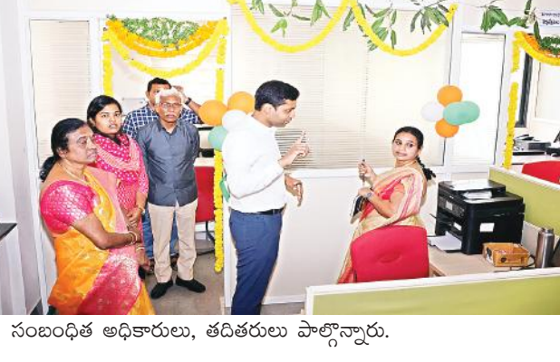
సంబంధిత అధికారులు, తదితరులు పాల్గొన్నారు.