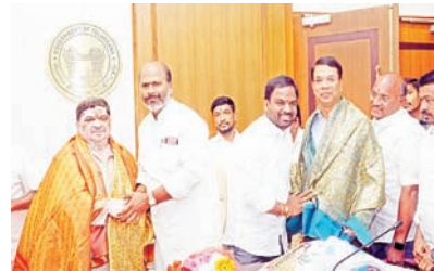
ఫిబ్రవరి 15 ఖమ్మం