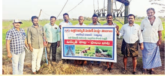
కల్లూరు సూర్య మేజర్ న్యూస్ ఫిబ్రవరి 14 :

63 కే వి ఏ ట్రాన్స్మార్టర్ 55 - 04 పరిధిలో విద్యుత్ సిబ్బంది పాలం బాట కార్యక్రమంలో భాగం గా రైతులతో బిజీ బిజీ గా గడిపారు. అందులో భాగంగానే అధికారుల రైతులకు విద్యుత్ గురించి తగు జాగ్రత్తలు తెలియ జేశారు. ఈ కార్యక్రమంలో విద్యుత్ అధికారులు రైతులు అధిక సంఖ్యలో పాల్గొన్నారు