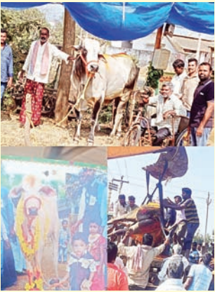
పెనుబల్లి సూర్య మేజర్ న్యూస్...

పెనుబల్లి మండలం కారాయి గూడెం గ్రామానికి చెందిన ఆంబోతు ఎద్దు శుక్రవారం రాత్రి మృతి చెందింది. ఆంబోతు కి గ్రామస్తులు సాంప్రదాయ రీతిలో భక్తి శ్రద్ధలతో గ్రామంలో ఊరేగిస్తూ అంత్య క్రియలు నిర్వహించారు. పాత కారాయి గూడెం శ్రీకృష్ణ దేవాలయ ప్రతిష్ఠ సం దర్శనంగా 2013 సంవత్సరంలో గిత్తను ఆంబోతుగా వదిలారు. 14 సంవత్సరాలు కలిగిన ఆంబోతుని గుర్తుతెలియని వాహనం ఇటీవల ఢీకొనడంతో కాయాలవెలయ అస్వస్థకు గురై పెనుబల్లి ప్రభుత్వసుపత్రి వద్ద పడి ఉండడంతో గమనించిన ప్రభుత్వ ఆసుపత్రి 108 సిబ్బంది, ఆసుపత్రి సిబ్బంది వెలర్నరీ వైద్యుల సహాయంతో ఆంబోతు ఎద్దుకి చికిత్స అందించారు. అనంతరం పాత కారాయిగూడెం గ్రామస్తులు గ్రామానికి తీసుకువెళ్లారు. అప్పటినుండి ఆంబోతు కి వైద్య సహాయం అందిస్తున్న ఫలితం లేకపోవడంతో శుక్రవారం ఆంబోతు తీవ్ర అస్వస్థకు గురై మృతి చెందింది. గ్రామస్తులు భక్తిశ్రద్ధలతో సాంప్రదాయ పద్ధతిగా అంతిక్రియలు నిర్వహించారు. ఈ కార్యక్రమంలో గ్రామ పెద్దలు, గ్రామస్తులు పాల్గొన్నారు.