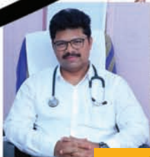
ఈ ఆరోగ్యశ్రీ సేవలను ప్రారంభించనున్న డిప్యూటీ సీఎం ముల్లు భట్టి విక్రమార్క