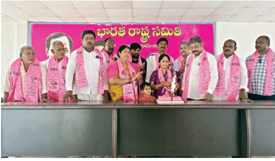
ప్రజల గుండెల్లో స్థిరస్థాయిగా కేసీఆర్ చేసిన అభివృద్ధి నాలుగు కోట్ల ప్రజల ఆకాంక్షను, 62 ఏళ్ల కలను సాకారం చేసిన ధీరుడు

సాగునీరు, తాగు నీరు కష్టాలను తొలగించిన అపరభగీరధుడు కేసీఆర్