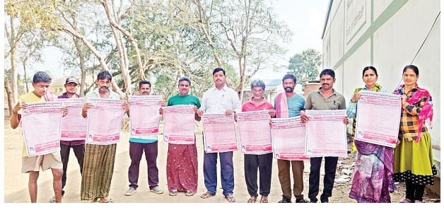
సత్తుపల్లి మేజర్ సూర్య న్యూస్: