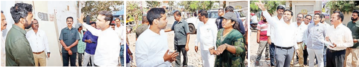
ఖమ్మం (సూర్య బ్యూరో):