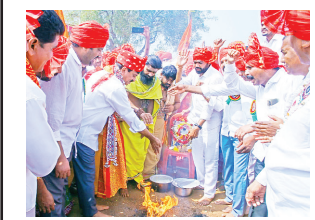
కూసుమంచి సూర్య మేజర్ న్యూస్....