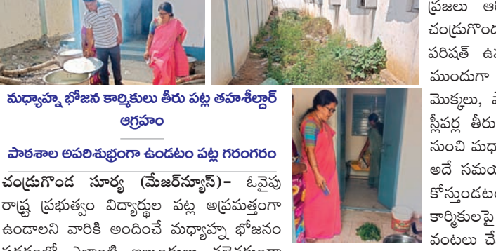
మధ్యాహ్న భోజన కార్మికులు తీరు పట్ల తహశీల్దార్ ఆగ్రహం