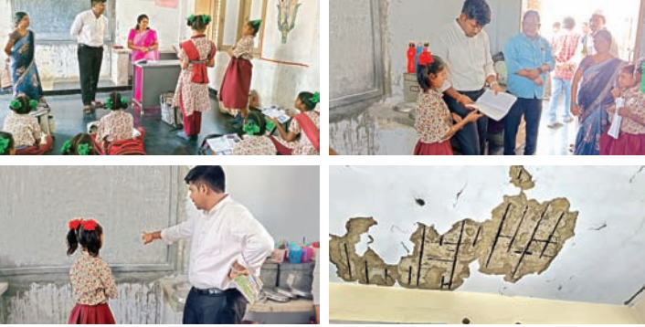
టీచరుగా మారి విద్యార్థులకు పలు ప్రశ్నలు రాబట్టిన పిఠి విద్యార్థుల టాలెంట్ మెరుగుపడేలా విద్యను బోధించాలి