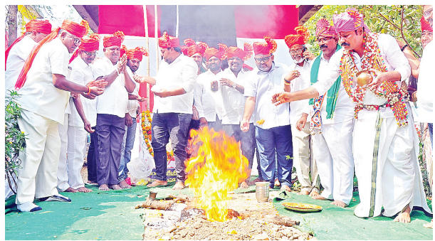
ఖమ్మం సూర్య అర్బన్ న్యూస్

- సేవల సేన రాష్ట్ర అధ్యక్షులు బానోత్ కిషన్ నాయక్