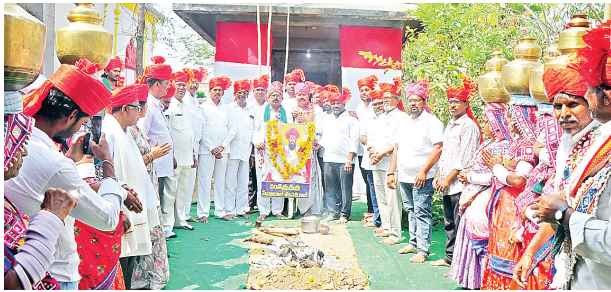
ఖమ్మం సూర్య టౌన్ న్యూస్