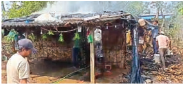
6 తులాల బంగారం, 90వేలు, విలువైన పత్రాలు అగ్నికి ఆహుతి