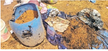
అగ్ని ప్రమాదంలో సర్వం కోల్పోయిన గుగులోత్ ఈరు కుటుంబం