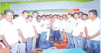
కూసుమంచి సూర్య మేజర్ స్టూన్ అర్జులైన ప్రతి జర్నలిస్టు కి ఇందిరమ్మ ప్రభుత్వంలో ఇళ్ల స్థలం