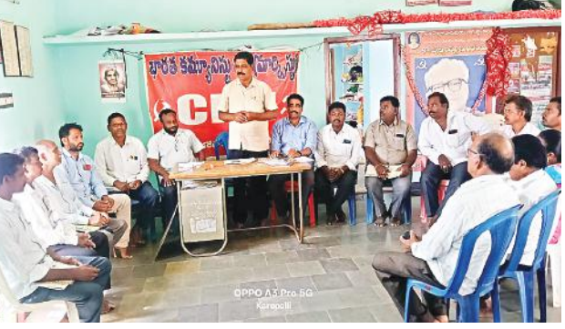
సింగరేణి సూర్య మేజర్ స్టూన్