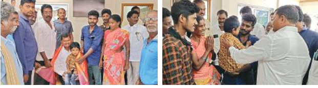
సర్దర్ నిమిత్తం ఎల్.పి.సి మంజూరి చేయించిన జారె