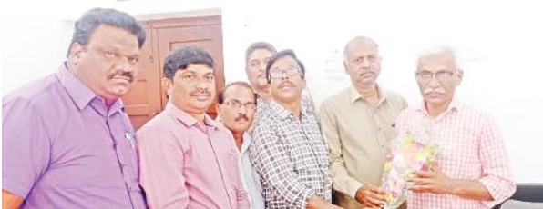
ఖమ్మం (సూర్య బ్యూరో):

-రాష్ట్రవ్యాప్త జర్నలిస్టుల ఇళ్ల స్థలాల పాలసీ రూపొందించే పనిలో ఉన్నాం..