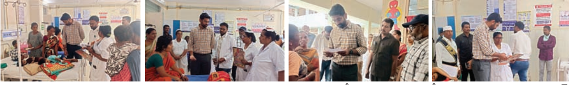
వైద్యులు, సిబ్బంది 24 గంటలు అందుబాటులో ఉండాలి..