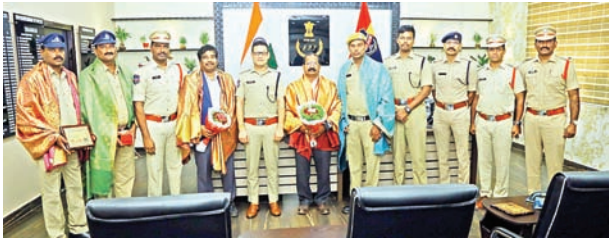
ఖమ్మం