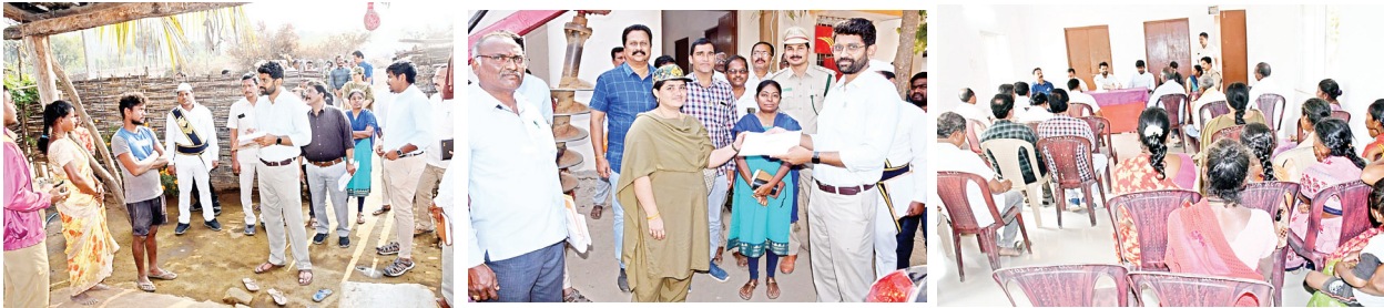
దమ్మపేట, సూర్య (మేజర్ స్టూన్) -