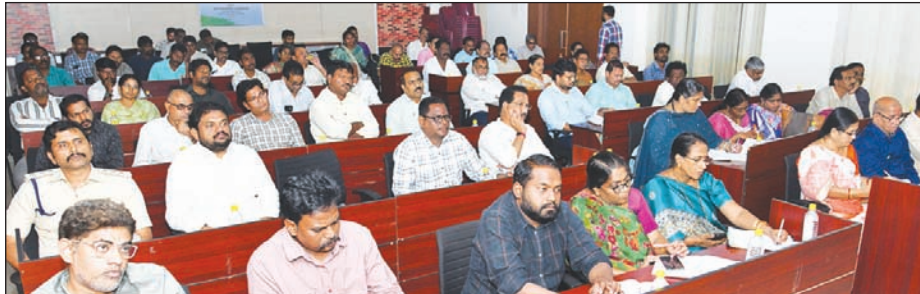
(వీవీటీ) సమావేశం జరిగింది. జిల్లాలో ఎన్నికల కోడ్ అమలు సరళితో పాటు ఫిర్యాదుల పరిష్కారం, రిపోర్టింగ్ మేనేజ్మెంట్, ఎలక్షన్ సీజన్ తదితరాలతో పాటు ఇకపైనా కోడ్ పటిష్ట అమలుకు తీసుకోవాల్సిన చర్యలపై అధికారులు