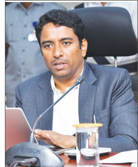
లకు మార్గనిర్దేశం చేశారు. నగదు, మద్యం, విలువైన లోహాలు తదితరాల అక్రమ రవాణాకు అడ్డుకట్ట వేసే విషయంలో 11 చెక్పోస్టుల సిబ్బంది, 24 ఫ్లయింగ్ స్టాఫ్ లు, 11 స్టాటిక్ స్ట్రెలెస్ బృందాలు అప్రమత్తంగా ఉండాలని స్పష్టం చేశారు. పోలీస్, ఎక్సైజ్, ఐటీ, 2