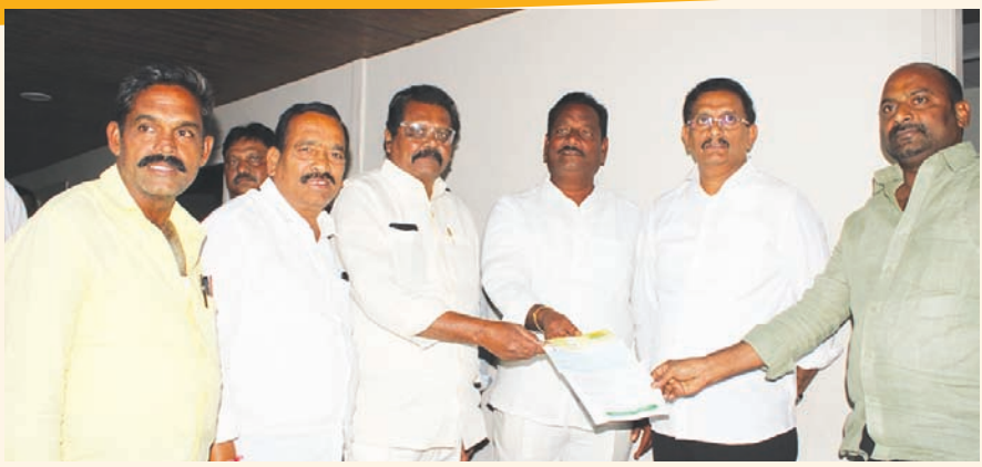
ప్రజల ఆరోగ్యమే ఎన్టీయే కూటమి లక్ష్యం 8